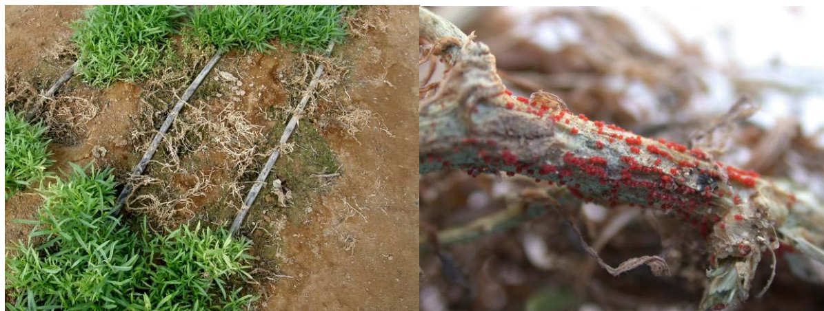
פוזריום סולני בטרגון

פטרייה הגורמת ריקבון בצוואר השורש ובשורשים. הריקבון מלווה בהתפתחות של גופי פרי רבים, כתומים ובולטים לעין. הפטרייה תוקפת לרוב צמחים שלהם רקע של תנאי עקה קודמים. משטר השקיה תקין וטיפול בפונגיצידי שיפרו את מצב הנגיעות.