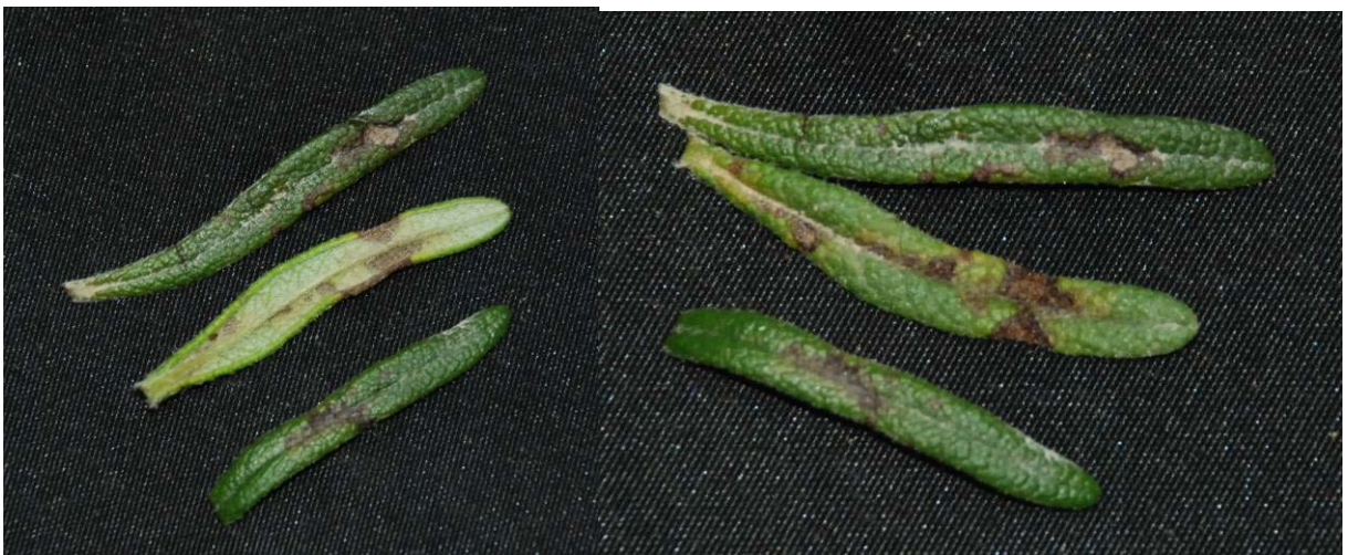
כתמי עלים ברוזמרין (עדיין לא הוגדרה הפטרייה)