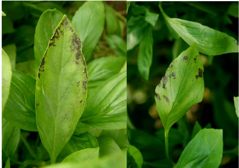
כתמי עלים בצמחים מבוגרים

כתמי עלים נגרמים ע"י גורמים א- ביוטיים וביוטיים. גורם המחלה שנמצא בבדיקות מעבדה הוא בעיקר חלפת. לאחרונה התגלו כתמי עלים גם על שתילים. פולאר נמצא יעיל בהדברת הפטרייה.